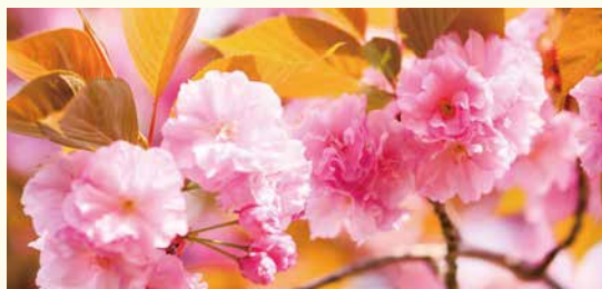
来年3月に八重桜の「西高さくら」を植樹いたします

多くの歴史がある私たちの母校、大阪府立西高等学校は102年の歴史に幕を閉じます。私たち102年目の卒業生は、入学以来、何をしても「最後の…」と言われ続け、私たちなりに出来ることをしてきました。西高校には「西高スピリット」として代々受け継がれている言葉があります。それは、石碑にも刻まれている「刻苦研鑽」という言葉です。「容易に楽な道を選ばず、あえて苦しい道を歩みながら自分を磨き上げてゆく」この姿勢は、時代や社会がどんなに変わろうとも、私たち一人一人が、今現在の目先の楽しみだけでなく、本当に充実した人生を送っていくために必要なものです。西高校の閉校は、次の新しい時代のための第一歩であることを私たちは感じています。桜和高校の中には、西高校がともに静かに息づいていくことでしょうか。私たちは、この学校で学んだことを誇りに思い、心に刻み、この西高校をあとにします。