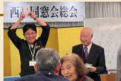
令和5年の同窓会総会(2023年5月28日) 60名の同窓生が参加しました。