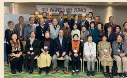
40期生普通科、商業科初の会「喜寿の会」 (2023年11月15日)